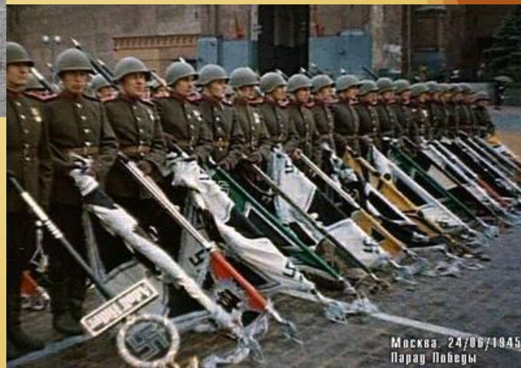
Москва: 24/06/1945 Парад Победы