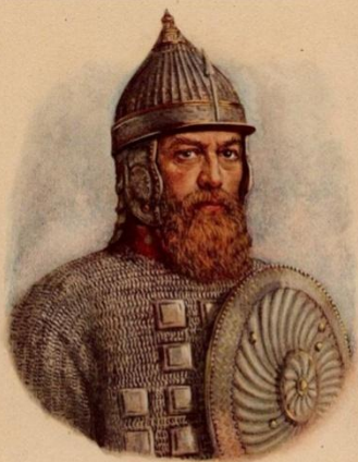
Дмитрий Пожарский 1578 – 1642